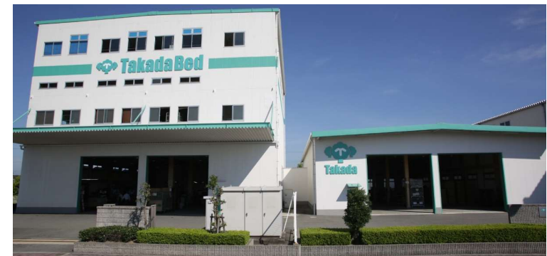
■ 第三工場/第四工場