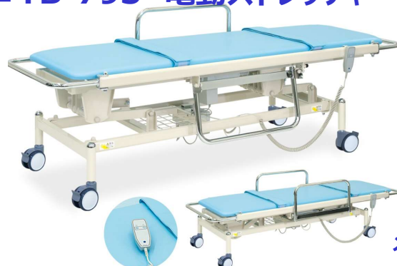
メディカルシリーズ

移動に便利なコードレス電動昇降式。安全性の高いスイングガード。AC100Vフル充電(10時間)で約50回の昇降が可能。手元スイッチ操作。直径10cmダブルロック式キャスター。レザー製安全ベルト2カ所付き。