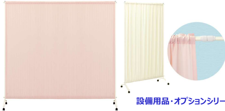
設備用品・オプションシリーズ

スペースに応じてカーテン幅を自由に伸縮できるシングルスクリーン。環境にやさしい粉体塗装仕上げのフレームを採用。丸洗い可能な生地。