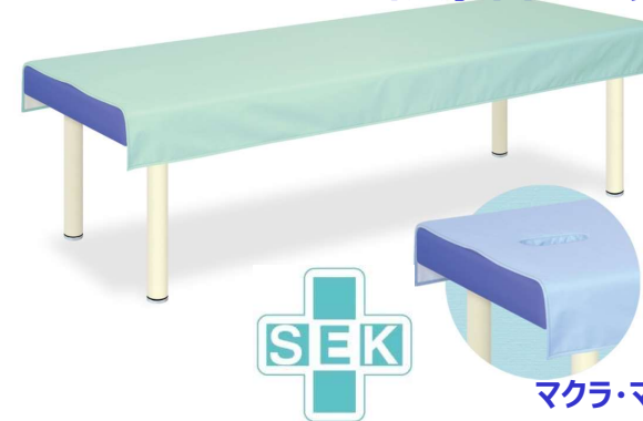
マクラ・マット・カバーシリーズ

裏面に滑り止め加工を施してズレにくくシワになりにくい材質を採用。(社)繊維評価技術協議会認定(SEKマーク)の抗菌防臭加工生地。