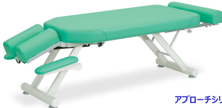
アプローチシリーズ

うつ伏せでの施術に最適な緊張を緩和する専用手置き台付き施術台。縦型調節式ヘッド。ガスシリンダー式角度調節機能付き。15°～40°。患者様の身長に応じて30cmの伸縮が可能なフットレスト機能付き。