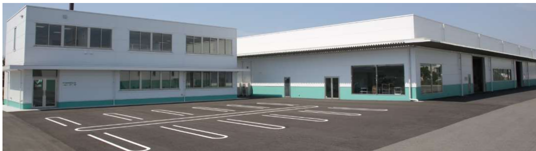
■ 本社事務所/本社工場