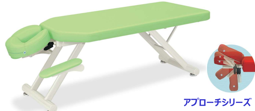
アプローチシリーズ

うつ伏せでの施術に最適な専用手置き台付き入門用廉価タイプ施術台。フェイス型ヘッド。最大10cmの高さ調節&無段階角度調節機能付き。床面との隙間を微調整できる直径6cmのオリジナルアジャスター付き。