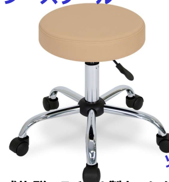
ソファー・チェアシリーズ

コンパクトで安定感抜群のスチール製クロムメッキ加工5本脚を採用。簡単なレバー操作で高さ調節できるガスシリンダー式昇降機能付き。耐久性の高い直径5cmのキャスターを採用。便利な360°回転式座面。