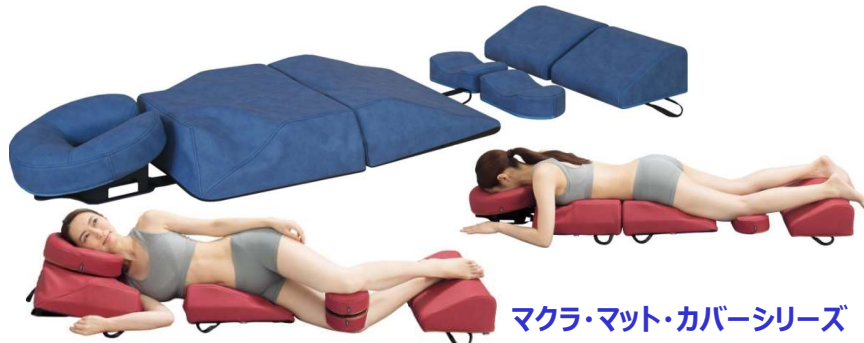
マクラ・マット・カバーシリーズ

5種類のサポートクッションから形成される極上のポジションを実現。人間工学に基づいた自然な状態の姿勢で脱力したリラックス感を提供。鍼灸やカイロから訪問マッサージや理学療法まで究極のボディマット。