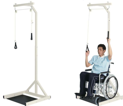
運動療法シリーズ

車イスから移動することなく上肢運動が始められる専用設計の訓練器。四十肩等の肩関節疾患や麻痺等を緩和する為の滑車式ストレッチ運動。患者様の体格に合わせて滑車幅とロープの長さを無段階に調節可能。