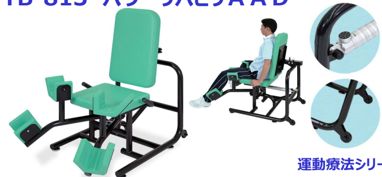
運動療法シリーズ

股関節の内転・外転筋肉を理想的な往復抵抗でリハビリトレーニング。8段階調節機能付き油圧シリンダーを採用。約1~9kgの範囲で調節可能。体格に応じて背もたれ位置が簡単に調節可能。2cm間隔5段階調節。